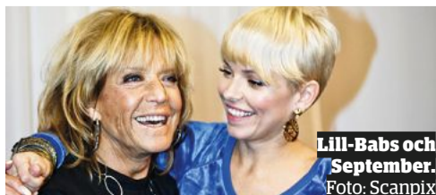
Lill-Babs och September.